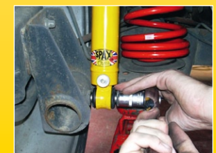
Die Windungen der Spiralfedern könnten sich berühren – das ist normal!