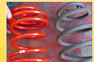
Vergleichen Sie die alten Federn und die neuen Federn