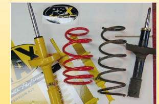
Montagereihenfolge mit der originalen Montagereihenfolge vergleichen