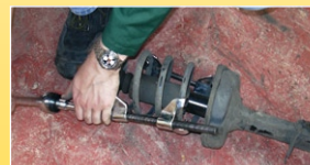
Die richtigen Werkzeuge benutzen