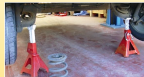
Das angehobene Fahrzeug absichern