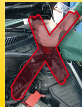
Verwenden Sie nie einen Schlagschrauber zum Befestigen der Kolbenstangenmutter