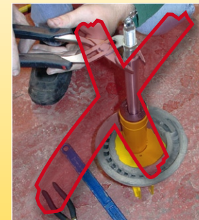
Greifen Sie nie mit einer Zange auf die Kolbenstange